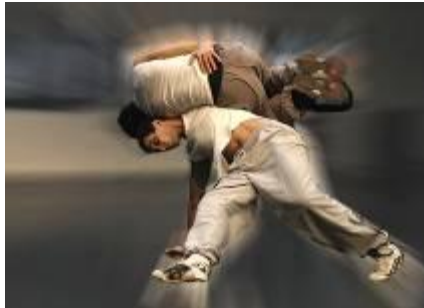
2001 Né pour l'Autre