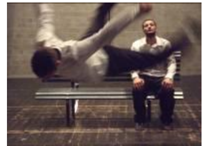
2009 Zig Zag