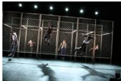
2008 Nos Limites