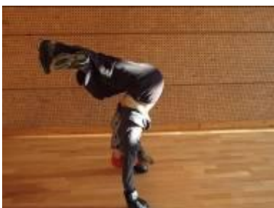
2009 Swingin' Savate