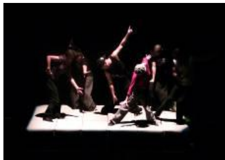
2010 Les S'tazunis